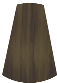
7.17 BIONDO MEDIO CASHMERE MEDIUM CASHMERE BLONDE RUBIO MEDIO CASHMERE