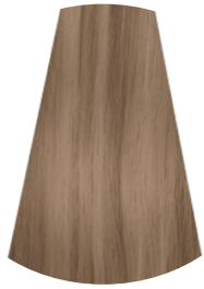
9A SABBIA SAND/ARENA