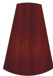
5.45 CASTANO CHIARO RAME MOGANO LIGHT COPPER MAHOGANY BROWN CASTAÑO CLARO COBRIZO CAOBA