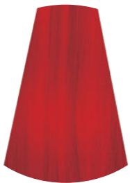
ROJO ROSSO RED