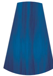
AZUL BLU BLUE