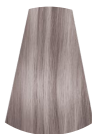
9.1 BIONDO CHIARISSIMO CENERE VERY LIGHT ASH BROWN RUBIO MUY CLARO CENIZO