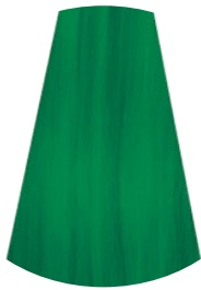
VERDE VERDE GREEN