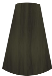
3.0 CASTANO SCURO DARK BROWN CASTAÑO OSCURO