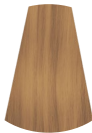
9.0 BIONDO CHIARISSIMO VERY LIGHT BLONDE RUBIO MUY CLARO