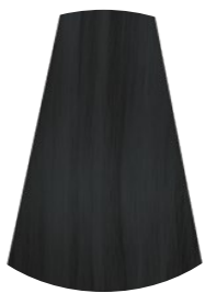
1.0 NERO BLACK NEGRO