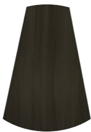
2.0 CAFFÉ COFFEE CAFÉ