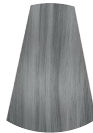
11.8 BIONDO PLATINO PERLA PLATINUM PEARL BLONDE RUBIO PLATINADO PERLA