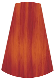
NARANJA ARANCIONE ORANGE