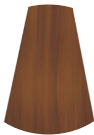
7.3 BIONDO MEDIO DORATO MEDIUM GOLDEN BLONDE RUBIO MEDIO DORADO