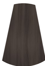
7.1 BIONDO MEDIO CENERE MEDIUM ASH BLONDE RUBIO MEDIO CENIZO