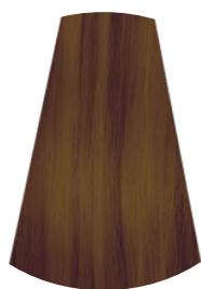
5.7 NOCE MOSCATA NUTMEG NUEZ MOSCADA