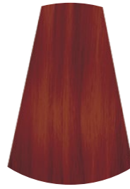
7.6 BIONDO MEDIO ROSSO MEDUM RED BLONDE RUBIO MEDIO ROJO