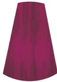
MAGENTA MAGENTA MAGENTA