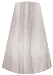
PLATA ARGENTO SILVER