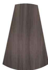
8.1 BIONDO CHIARO CENERE LIGHT ASH BROWN RUBIO CLARO CENIZO