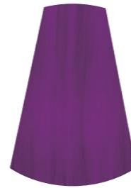
VIOLETA VIOLA VIOLET