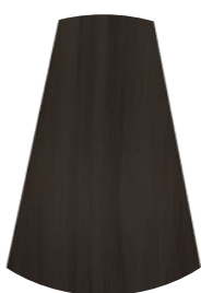
6.1 BIONDO SCURO CENERE DARK ASH BROWN RUBIO OSCURO CENIZO