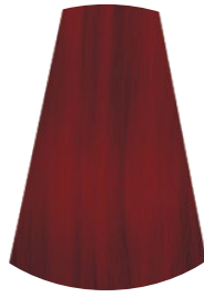
6.66 BIONDO SCURO ROSSO VIVO DARK VIVID RED BLONDE RUBIO OSCURO ROJO VIVO