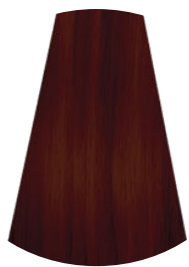
6.4 BIONDO SCURO RAME DARK COPPER BLONDE RUBIO OSCURO COBRE