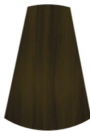
4.0 CASTANO MEDIO MEDIUM BROWN CASTAÑO MEDIO