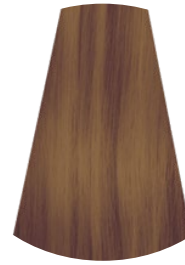
8.21 BIONDO CHIARO PERLA CENERE LIGHT PEARL ASH BLONDE RUBIO CLARO NACARADO CENIZO