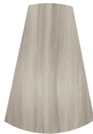
10.1 BIONDO PLATINO CERE PLATINUM ASH BLONDE RUBIO PLATINO CENIZO