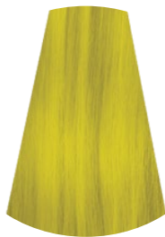
AMARILLO GIALLO YELLOW