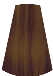
6.87 WENGÉ WENGÉ WENGÉ