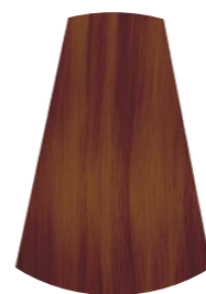
6.74 BISCOTTO AL CACAO CACAO COOKIE GALLETA AL CACAO