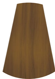
7.00 BIONDO MEDIO INTENSO INTENSE MEDIUM BLONDE RUBIO MEDIO INTENSO