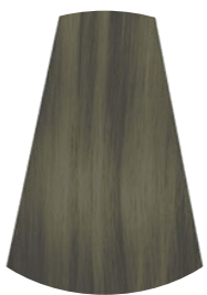
7.11 BIONDO MEDIO CENERE INTENSO MEDIUM INTENSE ASH BLONDE RUBIO MEDIO CENIZO INTENSO