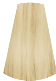
10.0 BIONDO PLATINO PLATINUM BLONDE RUBIO PLATINO