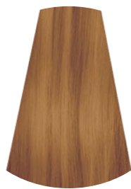
8.3 BIONDO CHIARO DORATO LIGHT GOLDEN BLONDE RUBIO CLARO DORADO