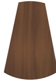
9.2 BIONDO CHIARISSIMO PERLA VERY LIGHT PEARL BLONDE RUBIO MUY CLARO NACARADO