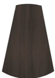
5.1 CASTANO CHIARO CENERE LIGHT ASH BROWN CASTAÑO CLARO CENIZO