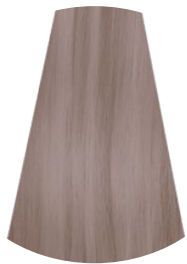
8.89 BIONDO CHIARO ARTICO LIGHT ARCTIC BLONDE RUBIO CLARO ARTICO