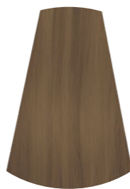
9.17 BIONDO CHIARISSIMO CASHMERE VERY LIGHT CASHMERE BLONDE RUBIO MUY CLARO CASHMERE