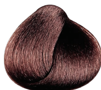
4.16 VIBRANT castaño ceniza rojizo CARMILANE