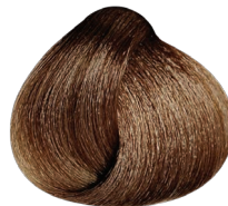
7.88 BRONDE rubio moka profundo