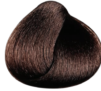
5.042 castaño claro natural cobrizo irisado