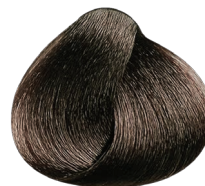
6.32 rubio oscuro dorado irisado