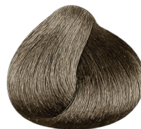
7.1 rubio ceniza