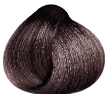
3.20 VIBRANT castaño oscuro irisado intenso CARMILANE + DMS