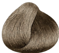
8.1 rubio claro ceniza