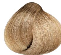
High Lift Ash+