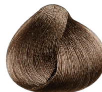
8.34 rubio claro dorado cobrizo