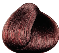
3.66 VIBRANT castaño oscuro rojizo profundo CARMILANE + DMS