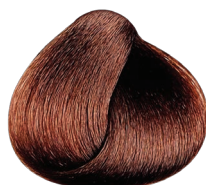
4.65 castaño rojizo caoba DMS