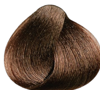
7.35 rubio dorado caoba