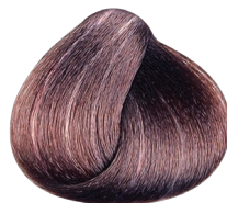
.21 Irisado Ceniza