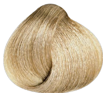
High Lift Beige