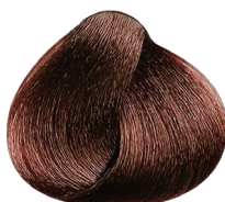
6.45 rubio oscuro cobrizo caoba