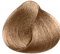
8.1 rubio claro ceniza