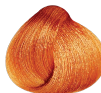
6.40 VIBRANT rubio oscuro cobrizo intenso RUBILANE