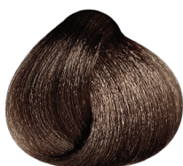
4.4 castaño cobrizo