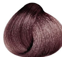
5.20 VIBRANT castaño claro irisado intenso CARMILANE + DMS