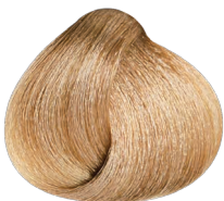
High Lift Gold Violet