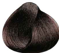
5.52 castaño claro caoba irisado