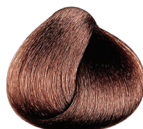
4.55 VIBRANT castaño caoba profundo CARMILANE