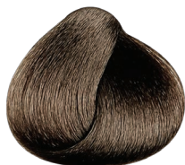
.11 ceniza profundo