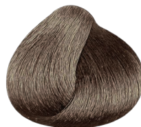
8.11 rubio claro ceniza profundo