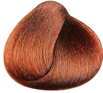
6.56 VIBRANT rubio oscuro caoba rojizo CARMILANE + RUBILANE