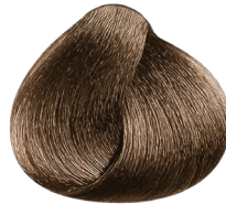
7.3 rubio dorado