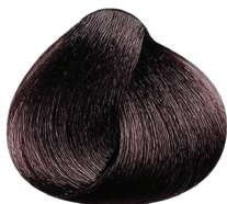
4.45 castaño cobrizo caoba