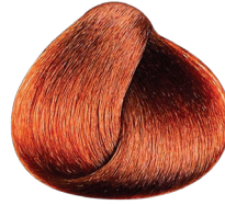
6.64 rubio oscuro rojizo cobrizo CARMILANE