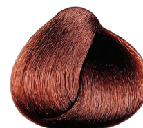
4.60 VIBRANT castaño rojizo intenso CARMILANE + DMS