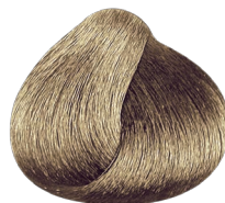
9.1 rubio muy claro ceniza