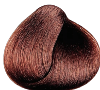
4.62 VIBRANT castaño rojizo irisado CARMILANE + DMS