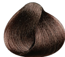
6.35 rubio oscuro dorado caoba