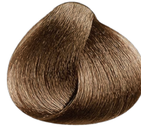
8 rubio claro