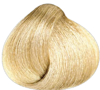
High Lift Neutral