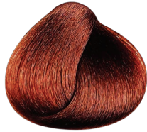
6.66 rubio oscuro rojizo profundo CARMILANE