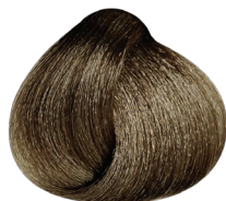
.12 ceniza irisado