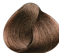
8.31 rubio claro dorado ceniza