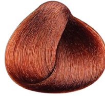
6.62 rubio oscuro rojizo irisado