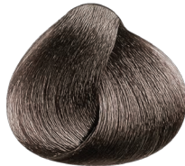
6.11 rubio oscuro ceniza profundo