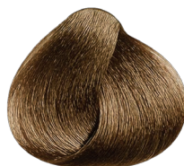
8.3 rubio claro dorado