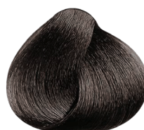
4.3 castaño dorado