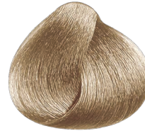
9.1 rubio muy claro ceniza