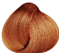
7.40 rubio cobrizo intenso RUBILANE