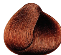
5.56 castaño claro caoba rojizo RUBILANE