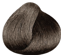
6.1 rubio oscuro ceniza