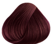
4.26 CASTAÑO MEDIO IRIZADO ROJO MEDIUM BROWN VIOLET RED