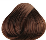
7.32 RUBIO MEDIO DORADO IRIZADO MEDIUM BLONDE GOLD VIOLET