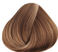
9.10 RUBIO CLARÍSIMO CENIZO VERY LIGHT BLONDE ASH