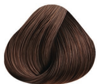
4CC CASTAÑO MEDIO MEDIUM BROWN