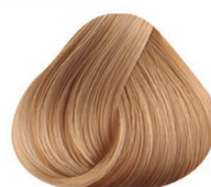
8.31 RUBIO CLARO DORADO CENIZO LIGHT BLONDE GOLD ASH