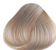
11.20 RUBIO ACLARANTE IRIZADO PLATINUM BLONDE VIOLET