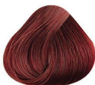
5.65 CASTAÑO CLARO ROJO CAOBA LIGHT BROWN RED MAHOGANY