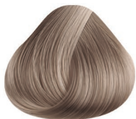
1000 CENIZO ASH