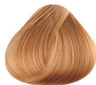
9CC RUBIO CLARÍSIMO VERY LIGHT BLONDE