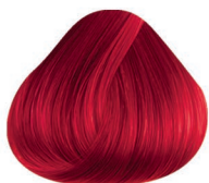
6RI ROJO INTENSO INTENSE RED