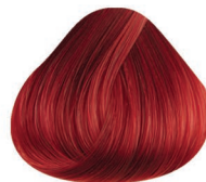
6000 ROJO RED