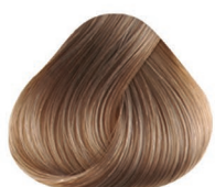
9.01 RUBIO CLARÍSIMO LIGERAMENTE CENIZO VERY LIGHT BLONDE NATURAL ASH