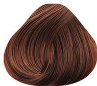
7.35 RUBIO MEDIO DORADO CAOBA MEDIUM BLONDE GOLD MAHOGANY