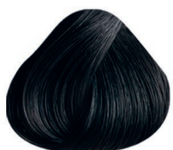
1.70 NEGRO AZUL DARK BLUE