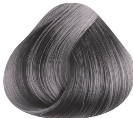
9.91 PLATA SILVER