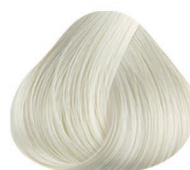
0-RA REFORZADOR ACLARANTE HIGH LIFTING REINFORCER