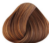
6 RUBIO OSCURO DARK BLONDE