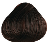
4.10 CASTAÑO MEDIO CENIZO MEDIUM BROWN ASH