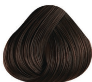
3 CASTAÑO OSCURO DARK BROWN