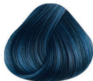
7000 AZUL BLUE