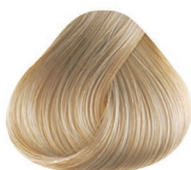
11.11 RUBIO ACLARANTE CENIZO INTENSO PLATINUM BLONDE INTENSE ASH