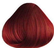
6.66 RUBIO OSCURO ROJO INTENSO DARK BLONDE RED INTENSE