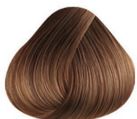
7.10 RUBIO MEDIO CENIZO MEDIUM BLONDE ASH