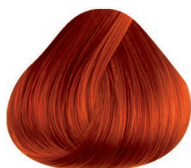
7CI COBRE INTENSO INTENSE COPPER