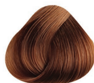
7 RUBIO MEDIO MEDIUM BLONDE