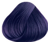
2000 IRIZADO VIOLET