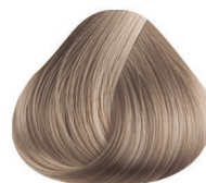
8.22 PERLADO PEARL