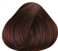
6.35 RUBIO OSCURO DORADO CAOBA DARK BLONDE GOLD MAHOGANY